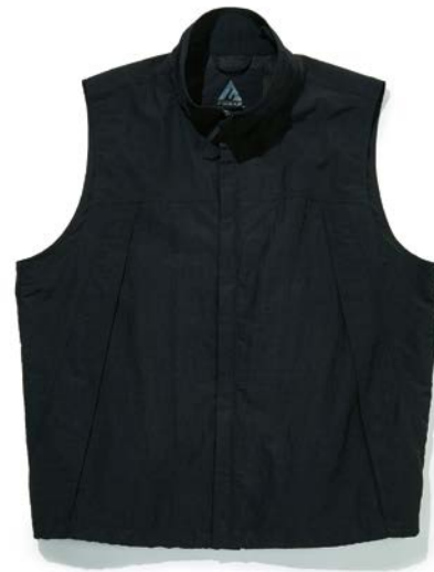
左ポケット内Dカン