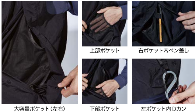
大容量ポケット(左右)